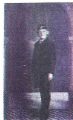
14 éves korában