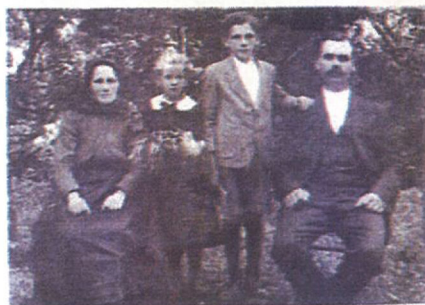
Szüleivel és húgával