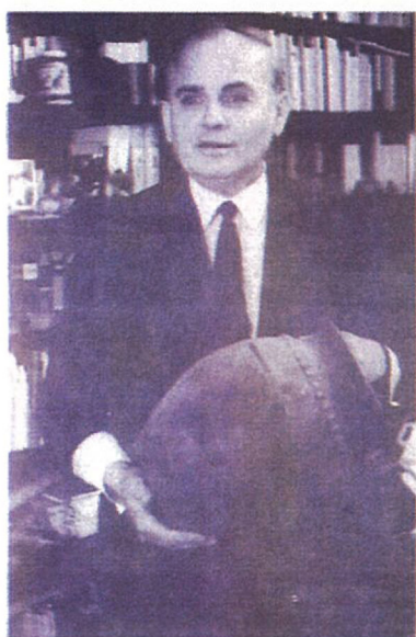
Nemcsak a könyvek érdekelték...