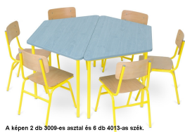
A képen 2 db 3009-es asztal és 6 db 4013-as szék.

Fémváz színe: ?, Laminált lap színe: ?, Asztalmagasság: ? ALTERNATIVA: 3904 Fémv. óvodai körasztal, t. ABS éllel d=120 cm (Nettó egységár: 22930 Ft)